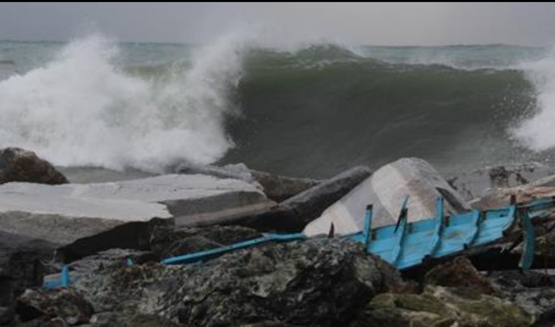
INVERNO: 5 marzo, relitto con la spettacolare mareggiata a Boccadasse – Genova