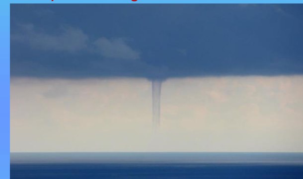
19 Ottobre , tromba marina nel genovese (Temporelli G.)