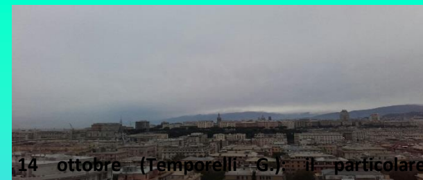
14 ottobre (Temporelli G.): il particolare episodio temporalesco ripreso a Genova si è poi spostato nel levante della regione, manifestandosi con un significativo 'macroburst' associato a violenti raffiche discendenti (record di 50 m/s da Sud a Fontana Fresca) con danni agli alberi dei Parchi di Nervi.