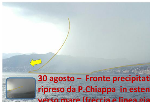
30 agosto – Fronte precipitativo ripreso da P.Chiappa in estensione verso mare (freccia e linea gialla)