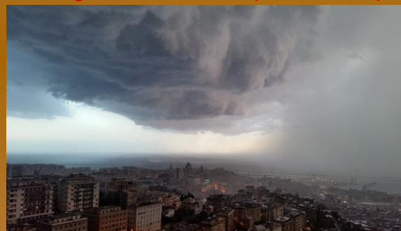
13 Luglio (Temporelli G.); Intenso Rovescio del per irruzione fredda e instabile sul genovese con crollo termico di circa 13 ° C in un'ora!