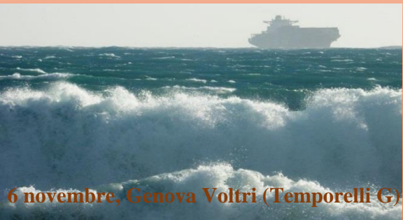
6 novembre, Genova Voltri

Dopo essersi rinforzate su C. Corso (per l'orografia) le onde si accentuano sul levante ligure: la mareggiata causò onde di 3.5 m (Nizza) e 5 m (alla Gorgona) e allagamenti a Sestri Levante.