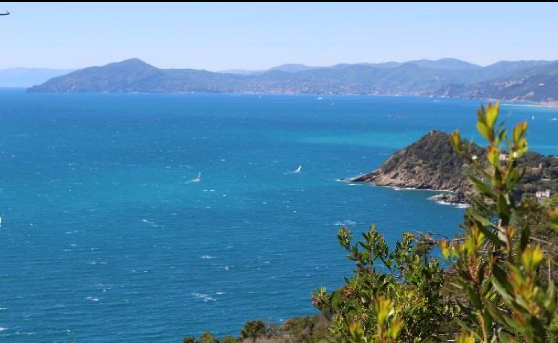
PRIMAVERA: 25 aprile, il golfo del Tigullio sotto un forte vento di Ponente (Onorato L.)