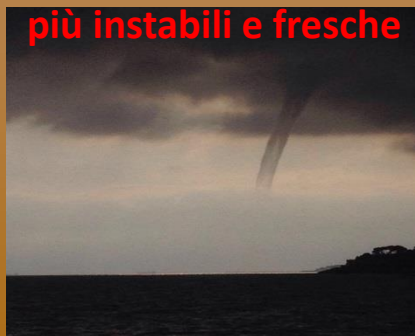
12 Luglio, trombe marine (Del Giudice T.)