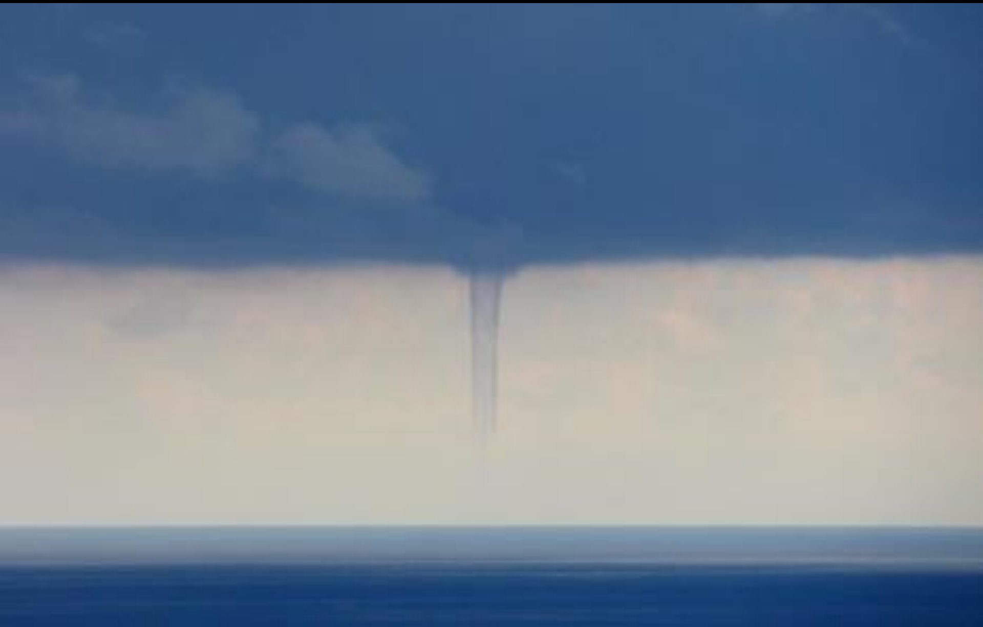
AUTUNNO: 19 Ottobre , tromba marina nel genovese (Temporelli G.)