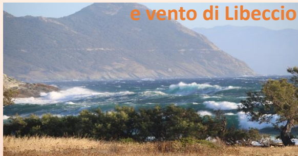
il 14-15 Luglio (Onorato); spettacolare Libecciate ripresa i sulla parte Nord-occidentale di C. Corso