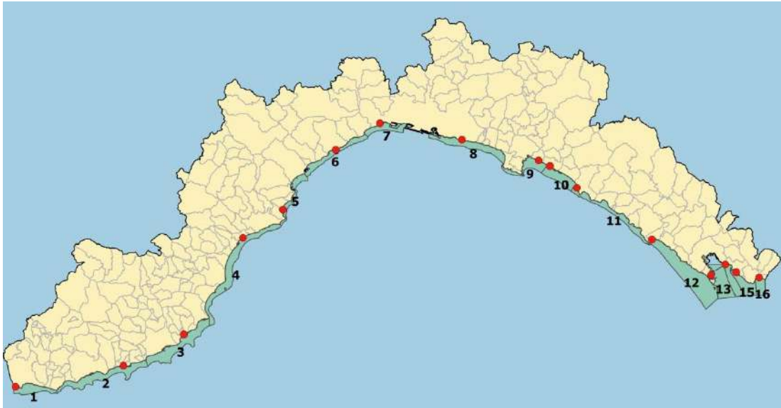
Figura 1. Mappa della rete di monitoraggio ligure dedicata alla fioriture algali potenzialmente tossiche: in rosso sono indicati i punti di campionamento all'interno delle rispettive aree rappresentative (in verde chiaro).